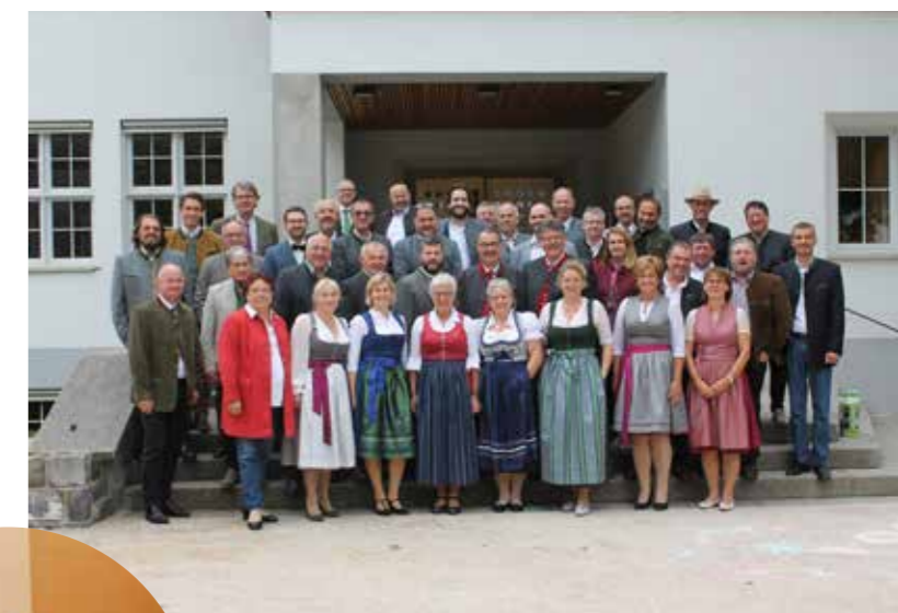
oben: Delegierte des Österreichischen Landarbeiterkammertages

Die Änderung der Statuten betrifft im Wesentlichen die Bezeichnung des ÖLAKT-Vorsitzenden bzw. der Stellvertreter, welche nunmehr auf Präsi-